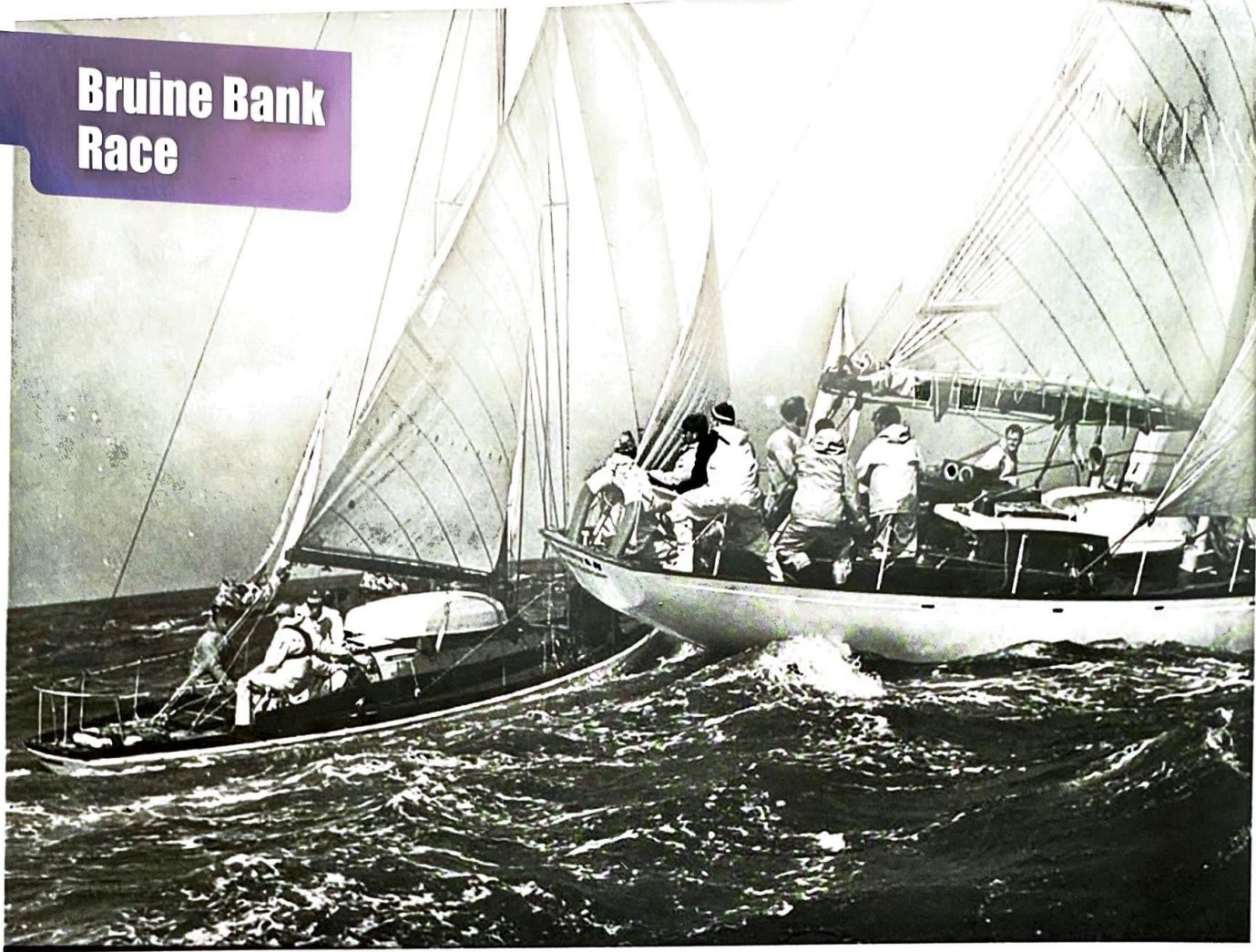
Fortuyn II (links) en Zwerver met ruime wind op volle zee.