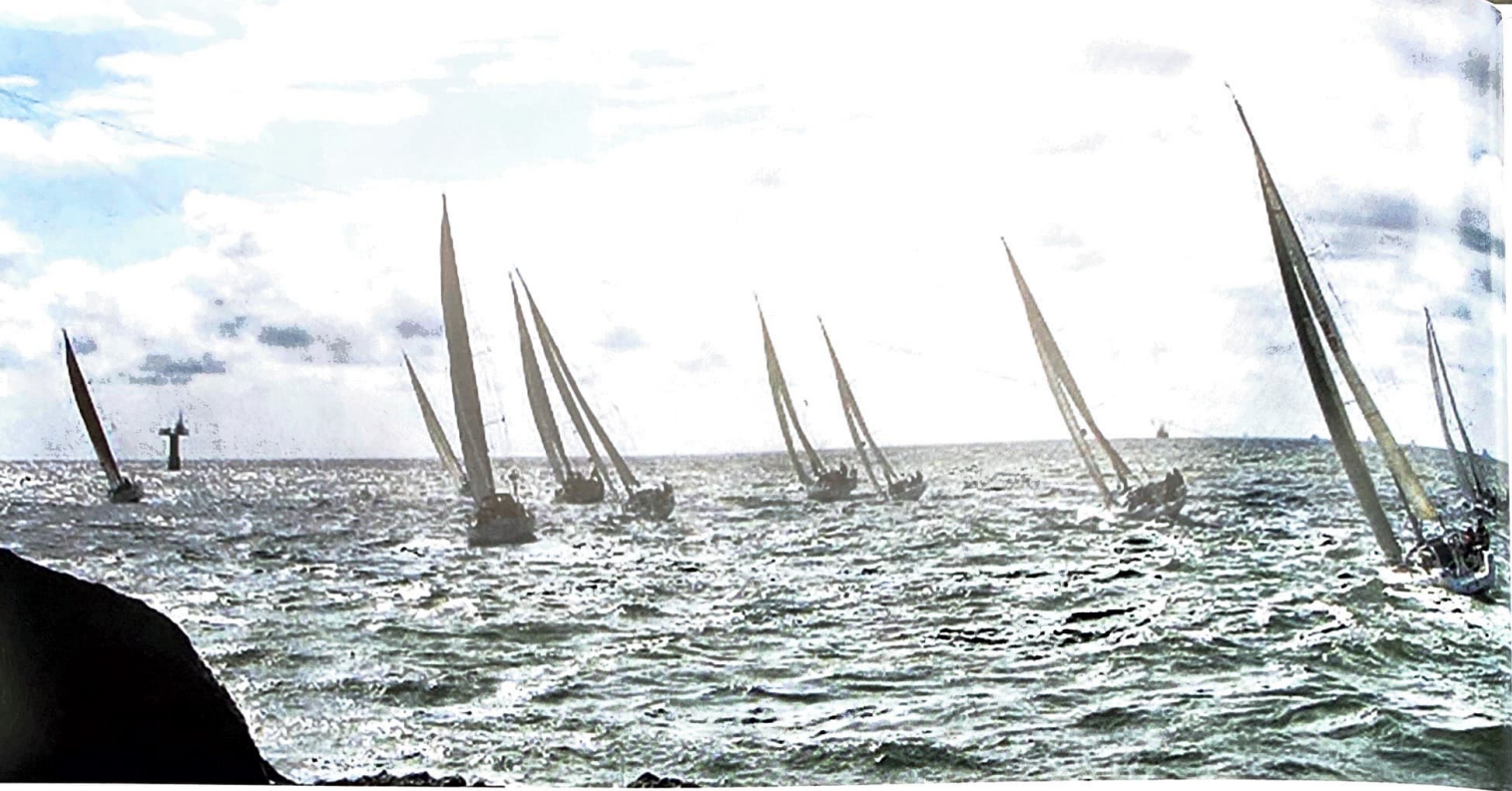
Nu niet meer voor te stellen, maar in 2012 lag de startlijn tussen de grote pieren van IJmuiden.

dat 'ie, op het moment waarop we elkaar tegen kwamen, al wist dat we het niet zouden gaan redden. We hadden een lesje in stroom en wind strategie gekregen. Uiteindelijk zijn maar zes boten gefinished. Snelste was Tuned, de Open 40 van de latere sponsor van deze wedstrijd. Arethusa werd tweede en was twee uur sneller dan Firestorm. Stinkfoot, een J/92 en Firestorm deelden de 4e/5e plaats. Zesde en laatste die nog wist te finishen was een J/105 genaamd JSMLXL.